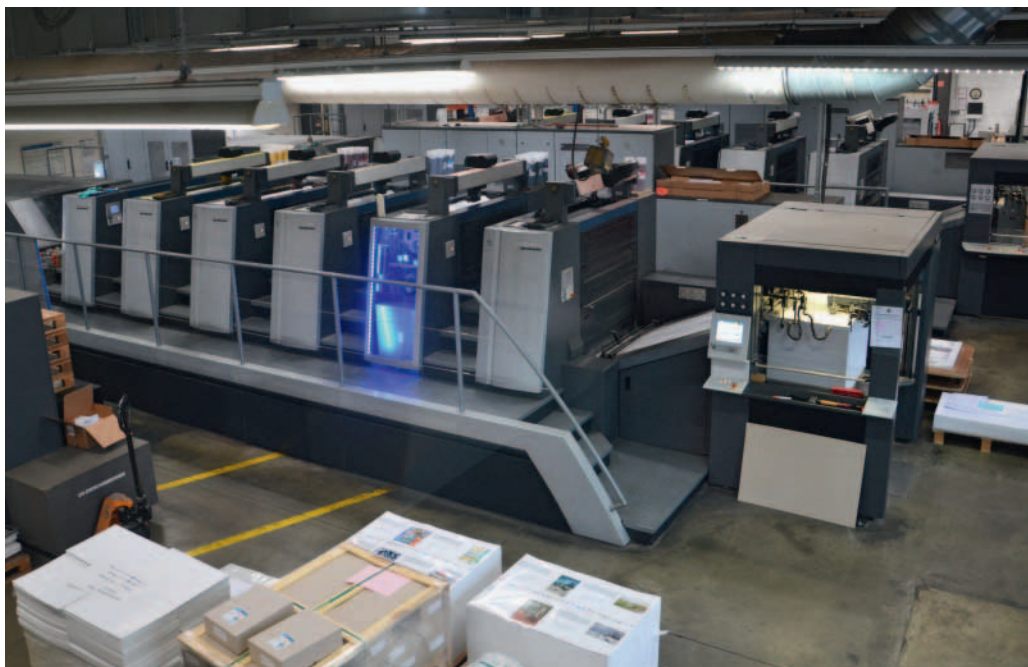
Premium-Druck im 3b-Format: Der Drucksaal von Druckstudio.

und Niederlassungen seiner Kunden mit kundenspezifischen Web-Shops schlank und effizient zu decken.