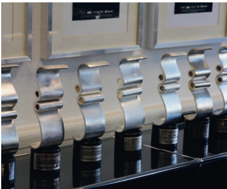
Ausgezeichnet: Zum siebten Mal gewann die Druckstudio-Gruppe im bedeutendsten Branchenwettbewerb der deutschen Druckindustrie.