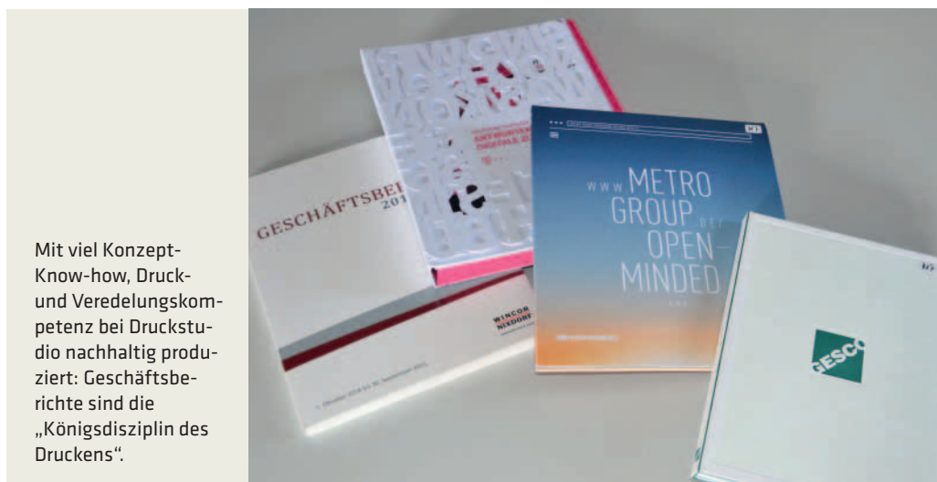
Mit viel Konzept-Know-how, Druck- und Veredelungskompetenz bei Druckstudio nachhaltig produziert: Geschäftsberichte sind die „Königsdisziplin des Druckens“.

„Mit der erneuten Auszeichnung in der Kategorie ‚Geschäftsberichtetrucker des Jahres‘ beweist die Druckstudio Gruppe einmal mehr ihr anhaltend hohes Niveau in der ‚Königsdisziplin des Druckens‘“, urteilte die Jury. Mit hochwertig gedruckten und sorgfältig veredelten Geschäftsberichten konnte das Düsseldorfer Unternehmen