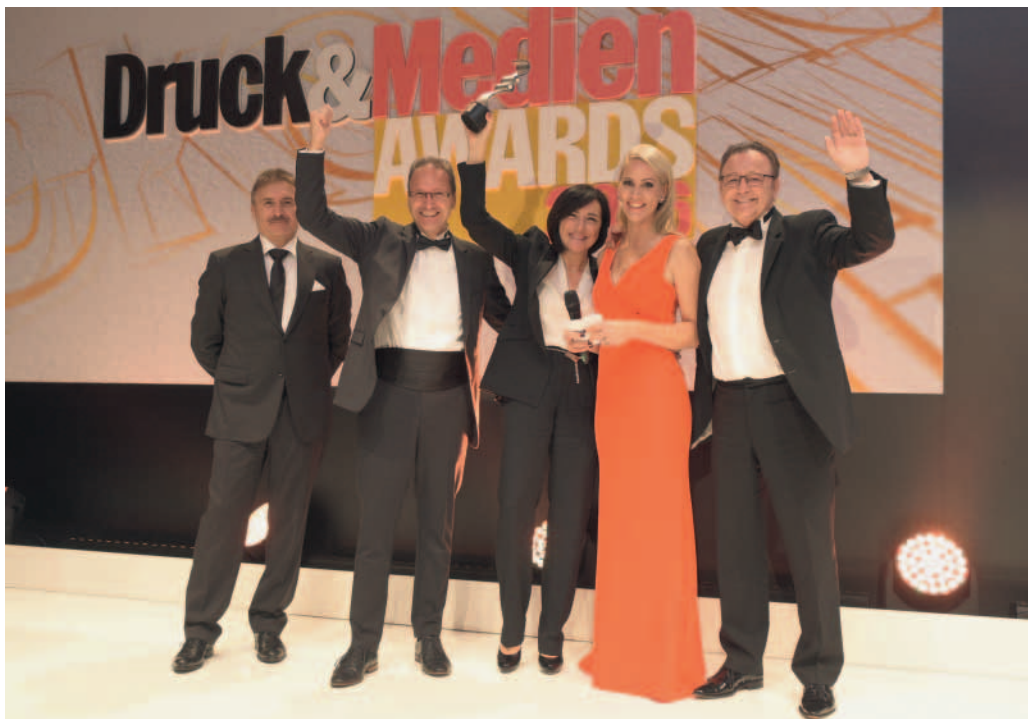
Bereits zum zweiten Mal in Folge hat die Druckstudio GmbH (Düsseldorf) den renommierten Druck&Medien Award in der Kategorie „Geschäftsberichtedruker des Jahres“ gewonnen. Neben der Auszeichnung in Gold gab es für das Unternehmen auch Silber in der Kategorie „Umweltorientiertes Unternehmen des Jahres“.

Emittenten – Wärme und Strom – ist die Druckstudio Gruppe heute klimaneutral.